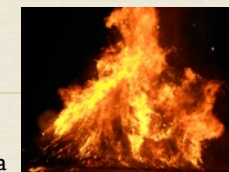
Il Pignarûl a Moimacco